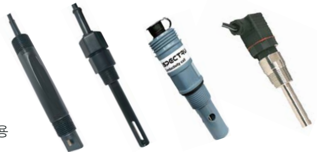
[ 4-cell ] [ DDG472 ]